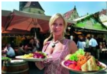
Villaggio del vino

Stoccarda , capoluogo della regione Baden-Württemberg, è situata in una delle principali regioni vinicole tedesche. Non poteva quindi mancare una festa dedicata al vino, è il cosiddetto "Villaggio del vino" che quest'anno si svolge dal 26 agosto al 6 settembre . Negli stand allestiti attorno al castello vecchio vengono serviti più di 250 eccellenti vini del Württemberg insieme a specialità tipiche della Svevia quali i